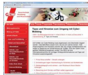
Mobbing ist gerade in der Schule ein verbreitetes Problem. Die Gewerkschaft „Erziehung und Wissenschaft“ wirbt auf ihrer Webseite für ein „prima Klima“ unter Schülern und Lehrern.