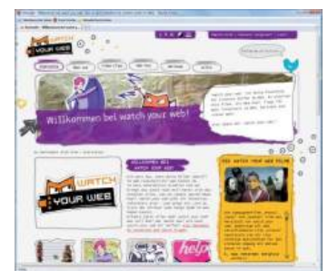
Auf der Seite www.watchyourweb.de finden Jugendliche Video-Clips, Mitmach-Aktionen und sogar einen Test, um den eigenen „Web-Typ“ zu bestimmen.