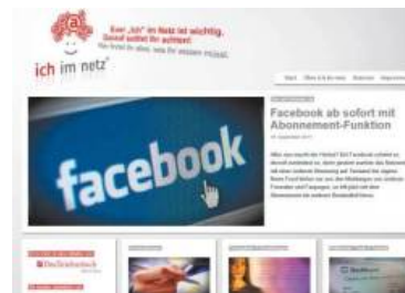
www.ichimnetz.de informiert über aktuelle Entwicklungen und gibt konkrete Tipps.

Es gibt keine Patentrezepte, um Mobbing vorzubeugen. „Kinder und Jugendliche können jedoch das Risiko reduzieren, indem sie online immer bedacht mit ihren persönlichen Daten und Fotos umgehen“, empfiehlt Katja Knierim von jugendschutz.net. Eltern sollten ihre Kinder auch darauf hinweisen, dass sie sich nach Möglichkeit nicht fotografieren oder filmen lassen. „Wenn auf einer Party Fotos geschossen werden, sollten sie den Fotografierenden fragen, was mit den Bildern geschieht und ihn darum bitten, die von ihnen gemachten nicht im Internet zu veröffentlichen.“ Knierim