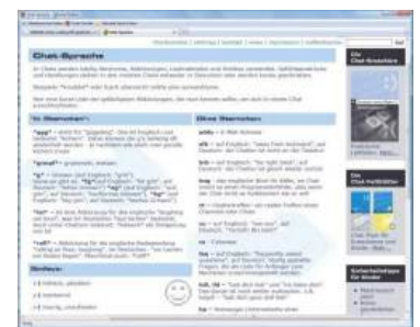
Webseiten mit Elterninfos stopfen Wissenslücken. Die Seite www.chatten-ohne-risiko.de erklärt die Gepflogenheiten beim Chat.