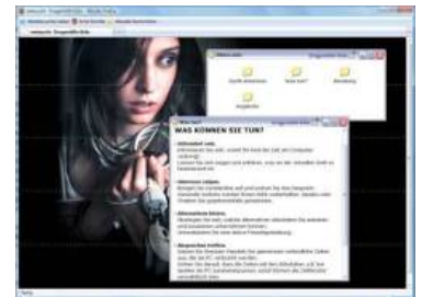
Cooler Aufmachung, klare Infos: Die Webseite www.websucht.info der Drogenhilfe Köln trennt die Bereiche mit Material für Jugendliche, Eltern und Pädagogen.