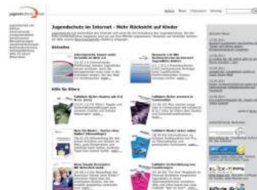
Für Eltern bietet www.jugendschutz.net Falbblätter und Broschüren zum Download an, teilweise auch in türkischer Sprache.