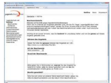
Unter www.jugendschutz.net kann man Verstöße gegen Jugendschutzbestimmungen melden.