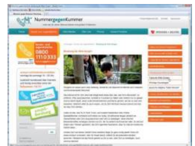
Beim Kinder- und Jugendtelefon „Nummer gegen Kummer“ erhalten Kinder und Jugendliche auch schriftliche Hilfe. Wer nicht anrufen mag, kann eine Mail schicken.

„Ob das bloße Streaming von Filmen oder Musik gegen das Urhebergesetz verstößt, wenn der Content illegal ins Netz gestellt wurde“, so der Fachanwalt