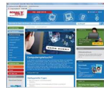
„Schau hin!“ ist eine Initiative vom Bundesministerium für Familie, Senioren, Frauen und Jugend, Vodafone, ARD, ZDF und TV Spielfilm.